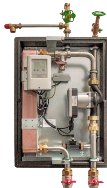
(Abbildung ohne Isolierung)