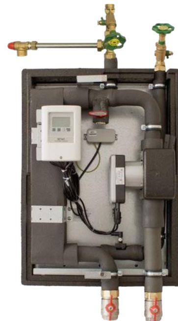
(Abbildung mit Isolierung)

Regelung und Sensoren: Eine drehzahlgesteuerte Regelung stellt sicher, dass die Kaltwassertemperatur konstant bleibt. Durch modernste Sensoren, wie den Vortex-Durchflusssensor, werden Durchflussmenge und Kaltwassertemperatur genau erfasst.